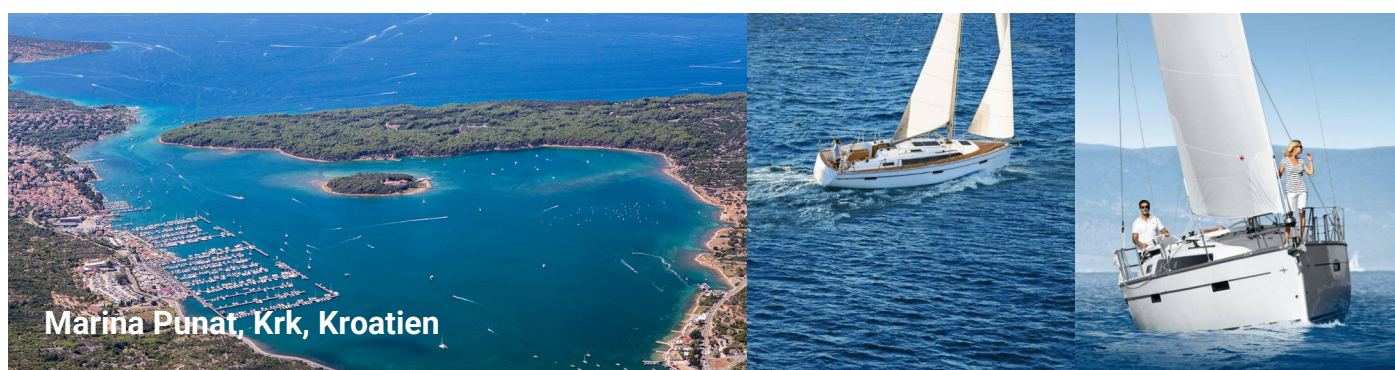
Marina Punat, Krk, Kroatien