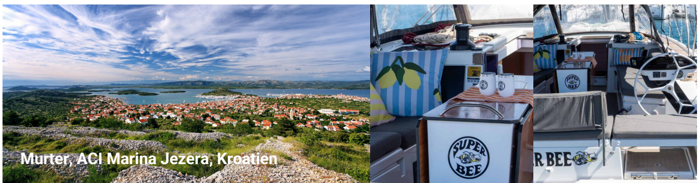
Murter, ACI Marina Jezera, Kroatien