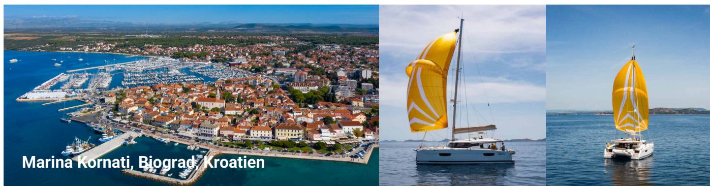
Marina Kornati, Biograd, Kroatien