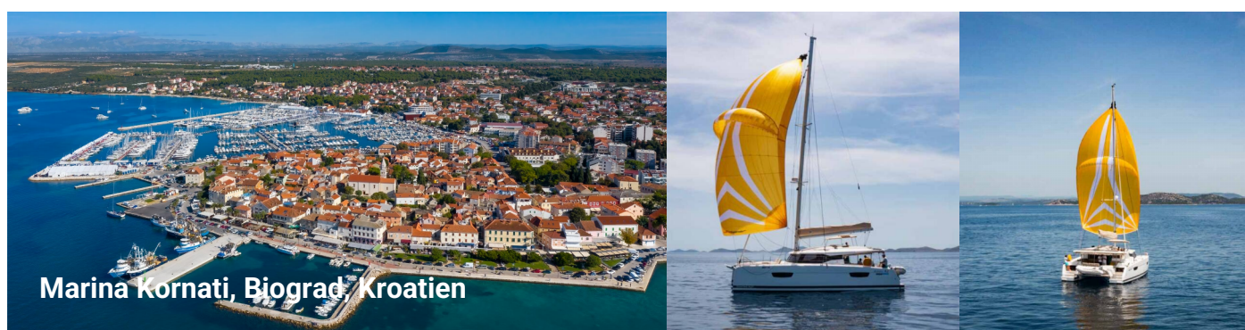
Marina Kornati, Biograd, Kroatien