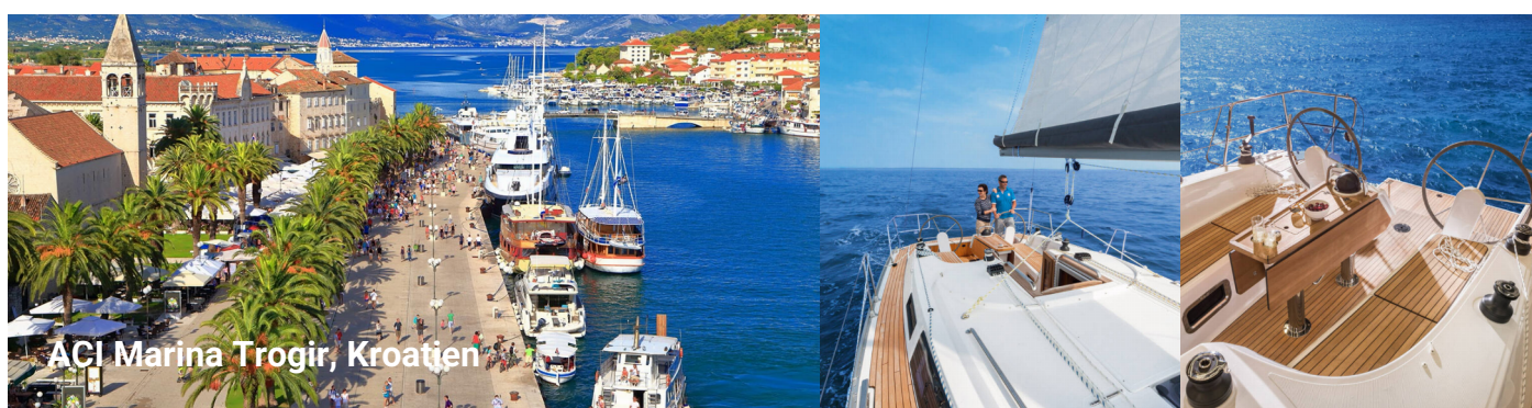
ACI Marina Trogir, Kroatien