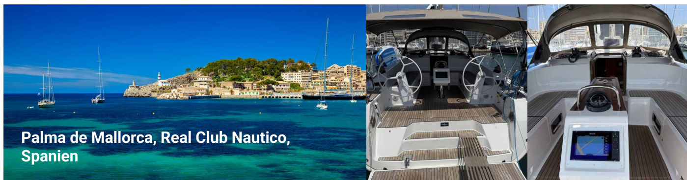
Palma de Mallorca, Real Club Nautico, Spanien