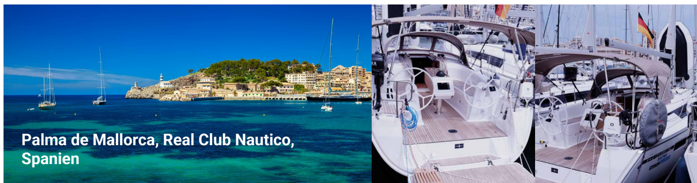
Palma de Mallorca, Real Club Nautico, Spanien