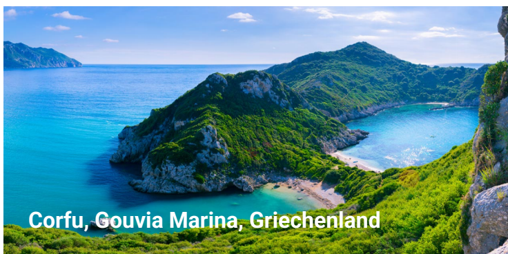
Corfu, Gouvia Marina, Griechenland