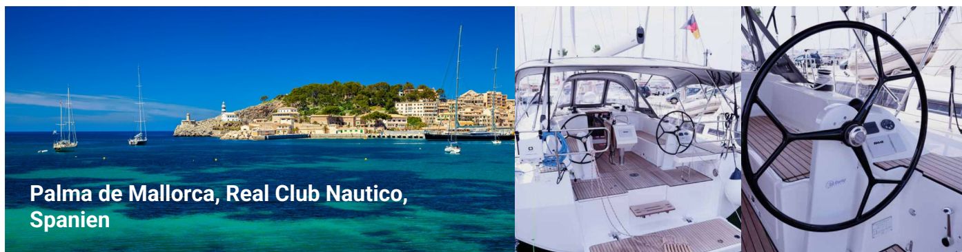
Palma de Mallorca, Real Club Nautico, Spanien