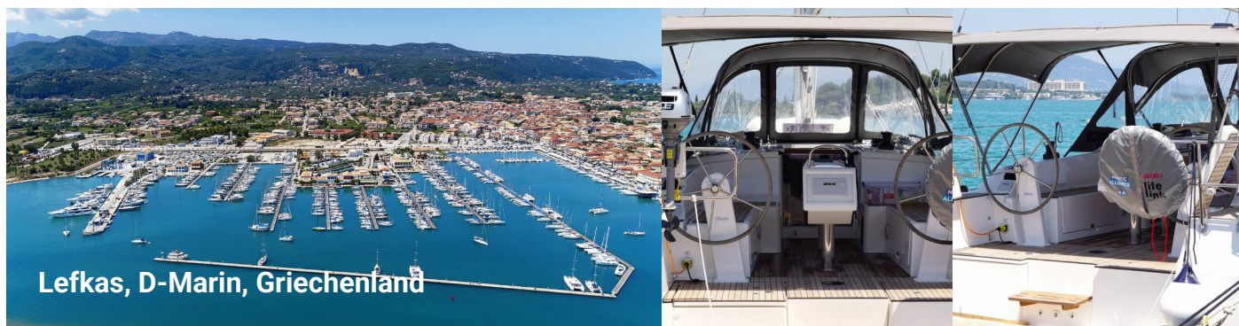
Lefkas, D-Marin, Griechenland