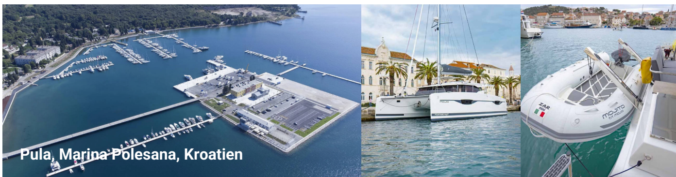
Pula, Marina Polesana, Kroatien