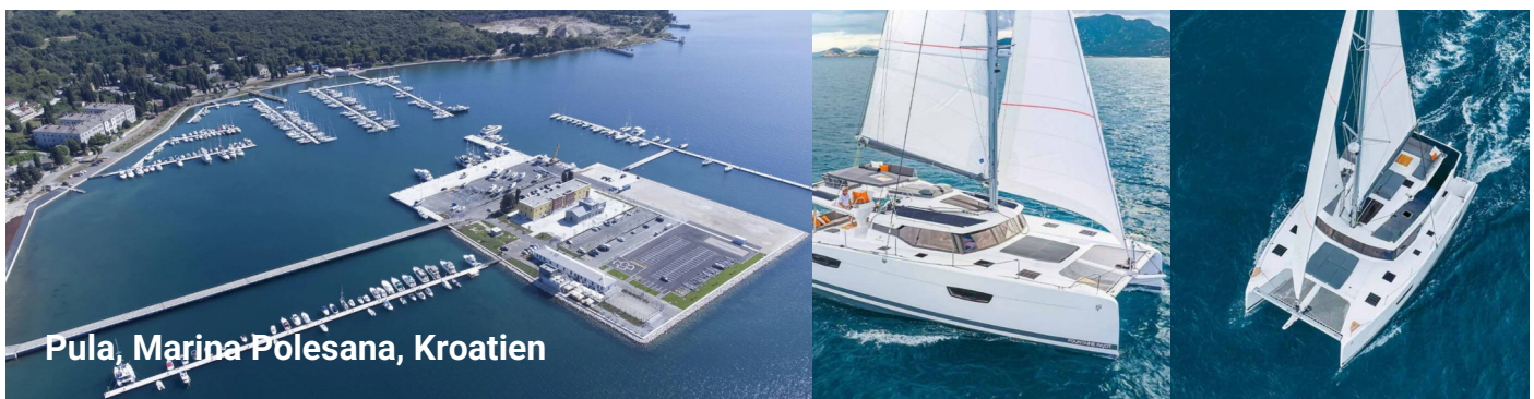
Pula, Marina Polesana, Kroatien