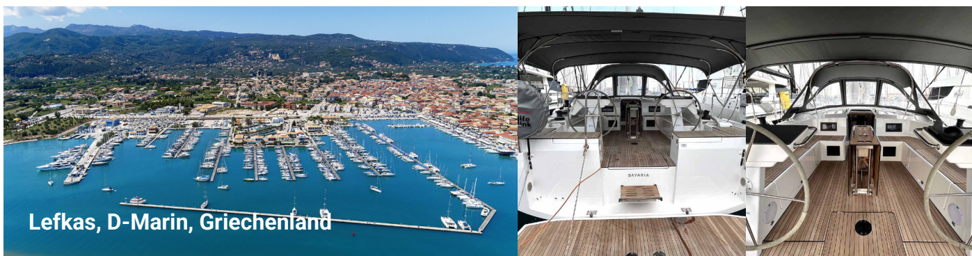
Lefkas, D-Marin, Griechenland