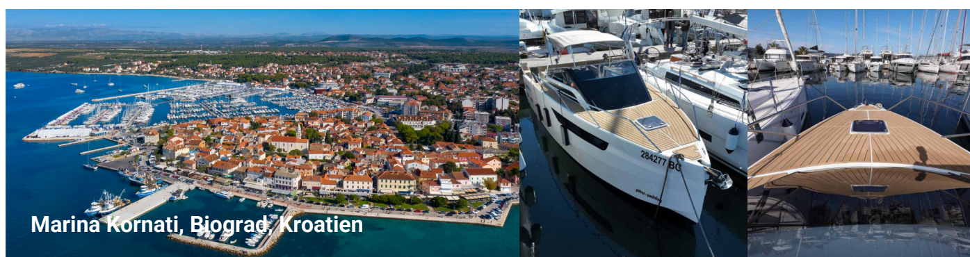
Marina Kornati, Biograd, Kroatien