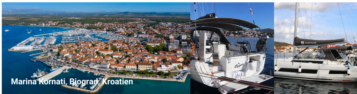
Marina Kornati, Biograd, Kroatien