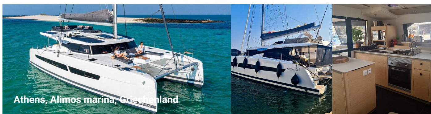
Athens, Alimos marina, Griechenland