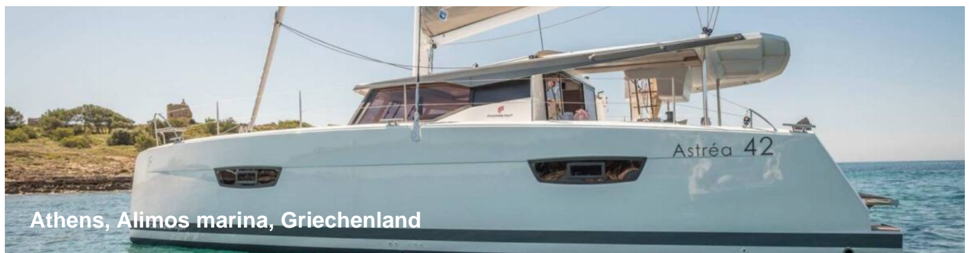
Athens, Alimos marina, Griechenland