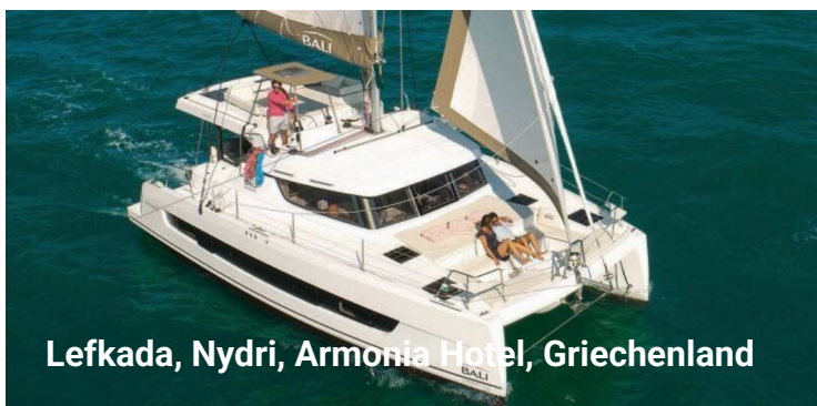
Lefkada, Nydri, Armonia Hotel, Griechenland