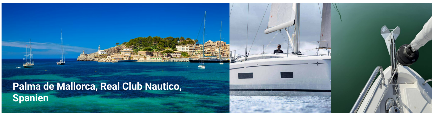
Palma de Mallorca, Real Club Nautico, Spanien