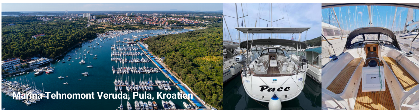
Marina Tehnomont Veruda, Pula, Kroatien