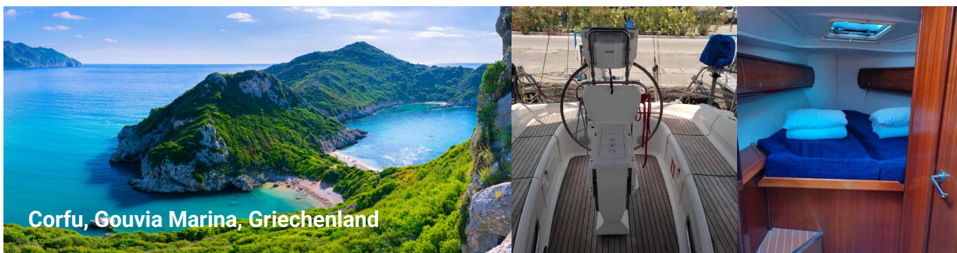
Corfu, Gouvia Marina, Griechenland