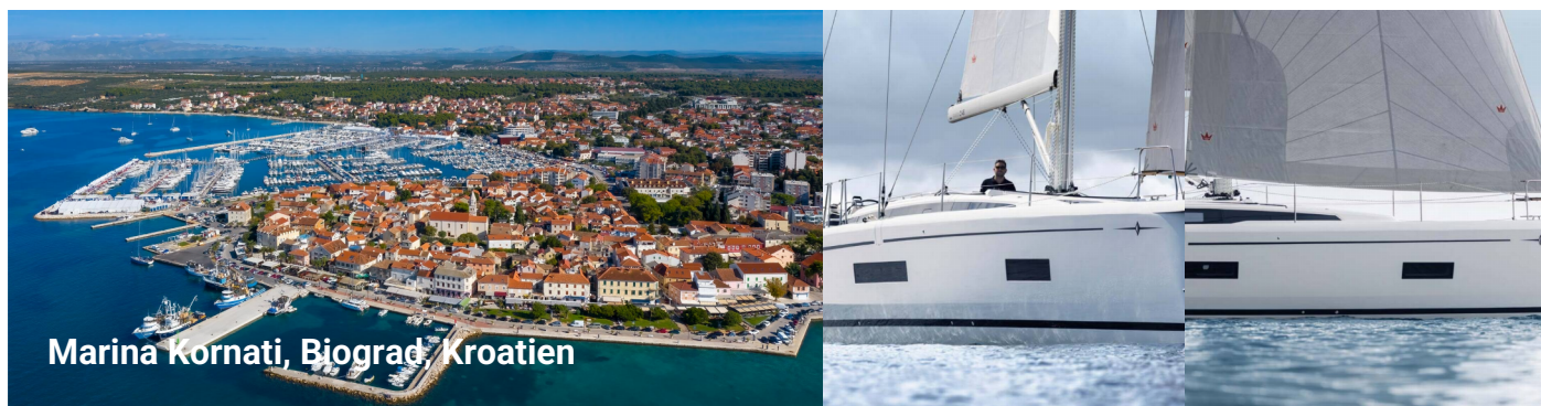
Marina Kornati, Biograd, Kroatien