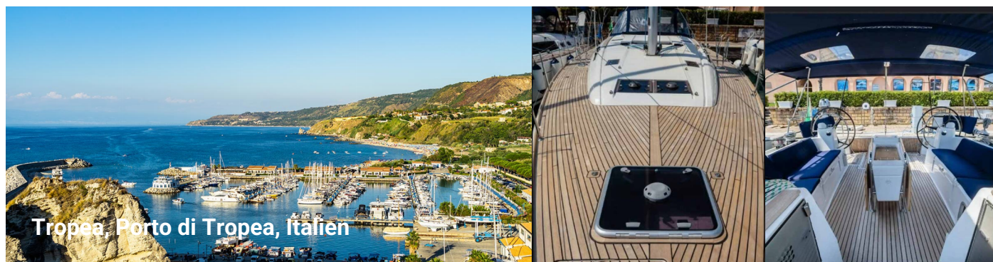
Tropea, Porto di Tropea, Italien