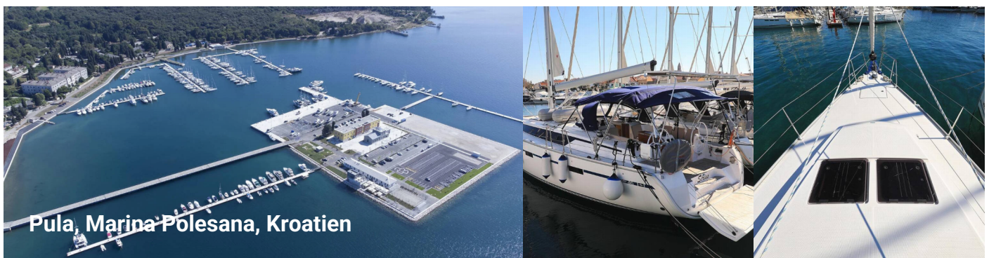
Pula, Marina Polesana, Kroatien