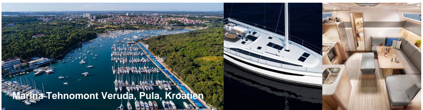
Marina Tehnomont Veruda, Pula, Kroatien