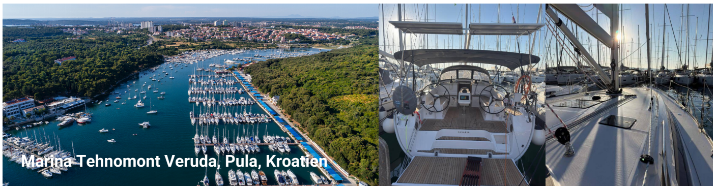
Marina Tehnomont Veruda, Pula, Kroatien