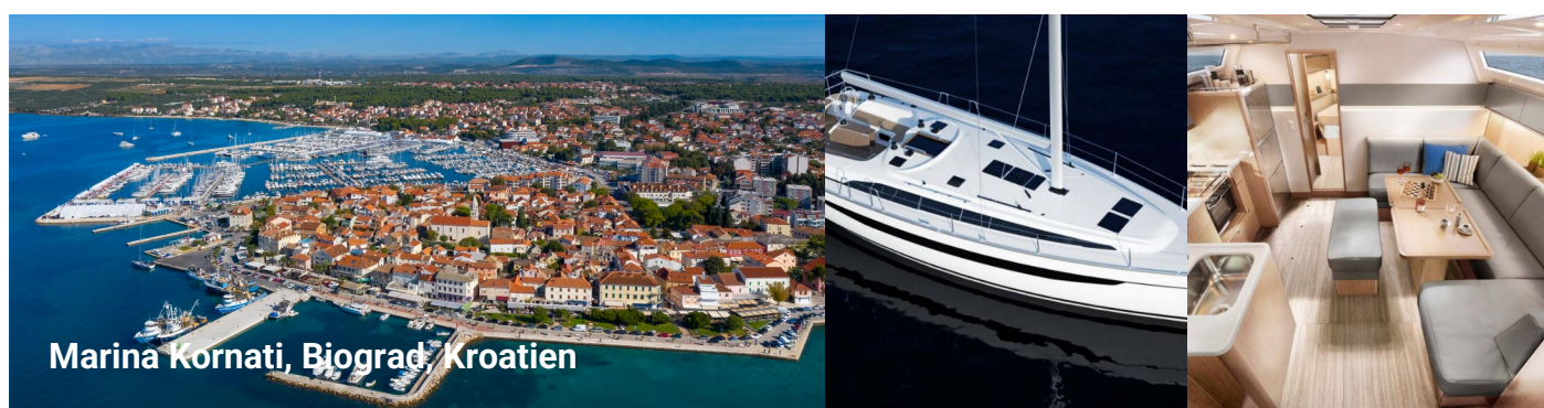
Marina Kornati, Biograd, Kroatien