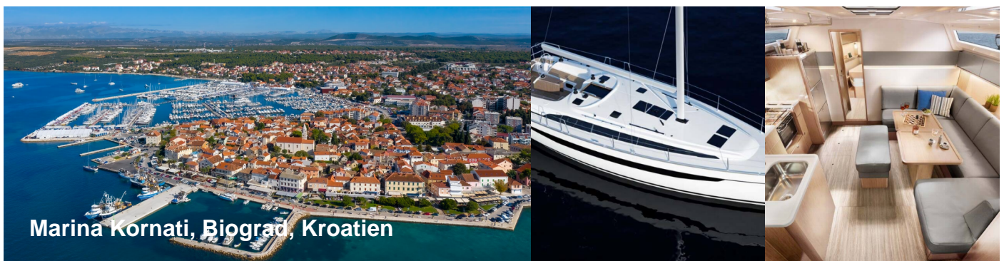
Marina Kornati, Biograd, Kroatien