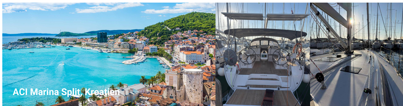
ACI Marina Split Kroatien