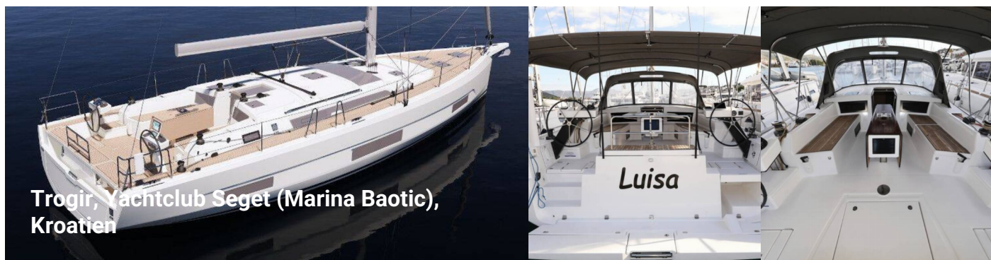
Trogir, Yachtclub Seget (Marina Baotic), Kroatien