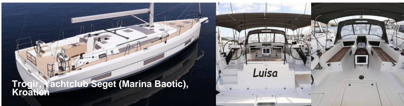
Trogir, Yachtclub Seget (Marina Baotic), Kroatien