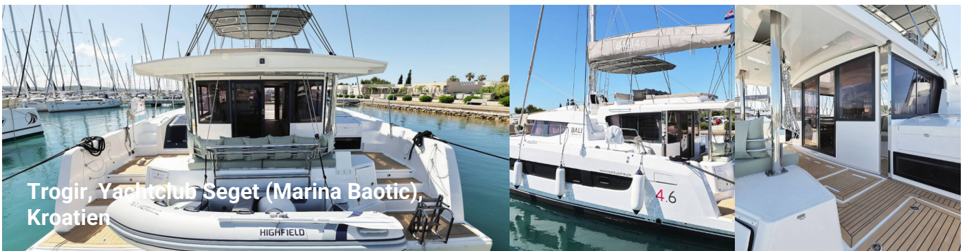
Trogir, Yachtclub Seget (Marina Baotic), Kroatien