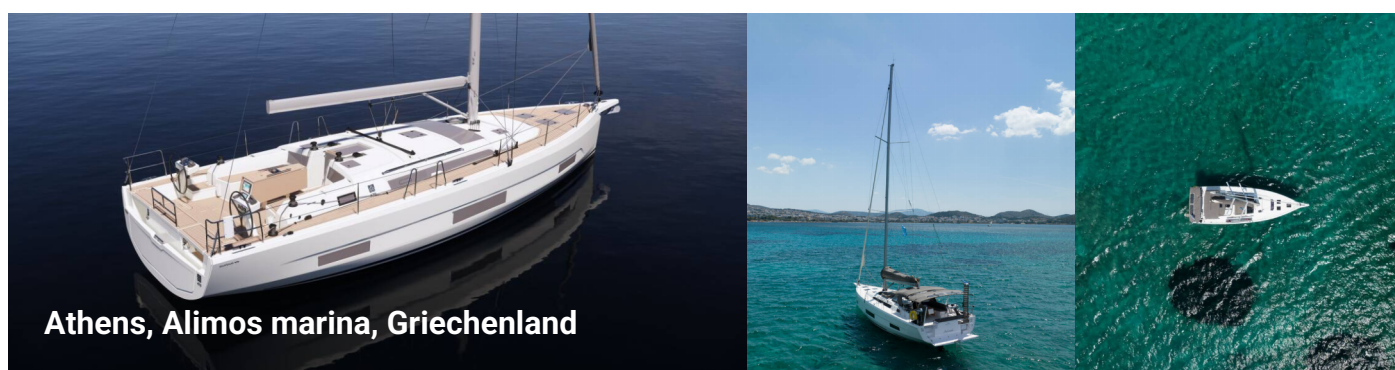
Athens, Alimos marina, Griechenland