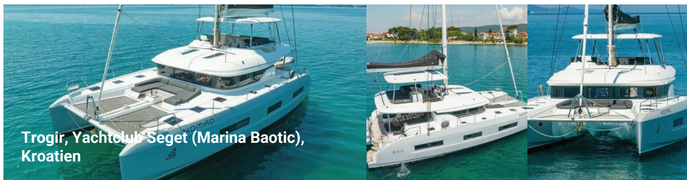
Trogir, Yachtclub Seget (Marina Baotic), Kroatien