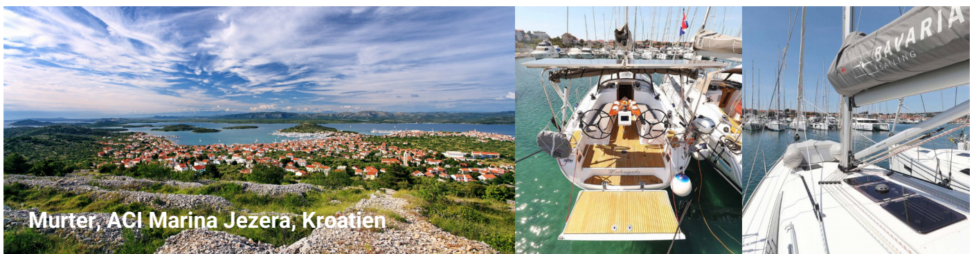
Murter, ACI Marina Jezera, Kroatien