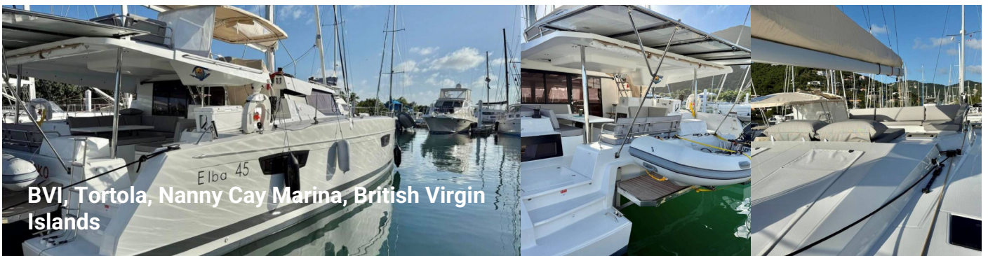
BVI, Tortola, Nanny Cay Marina, British Virgin Islands