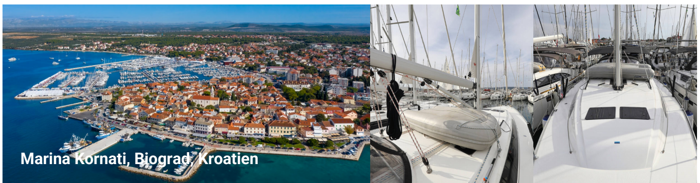
Marina Kornati, Biograd, Kroatien