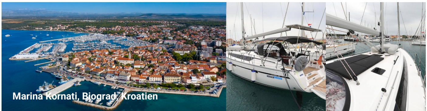
Marina Kornati, Biograd, Kroatien