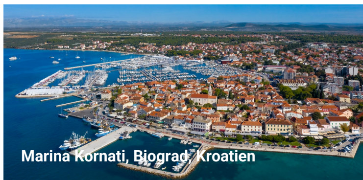
Marina Kornati, Biograd, Kroatien