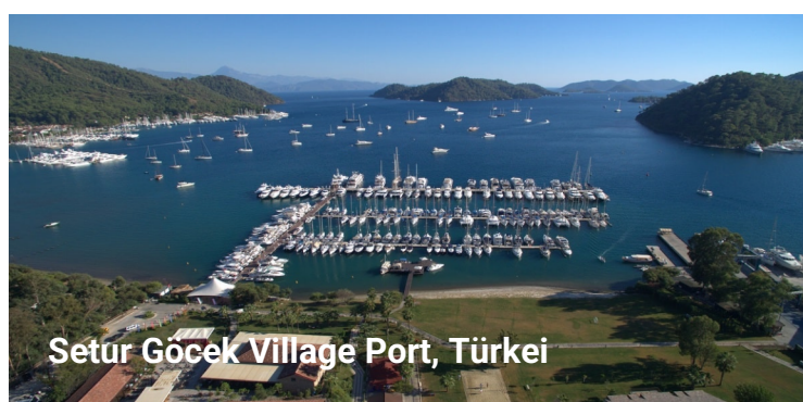
Setur Göcek Village Port, Türkei