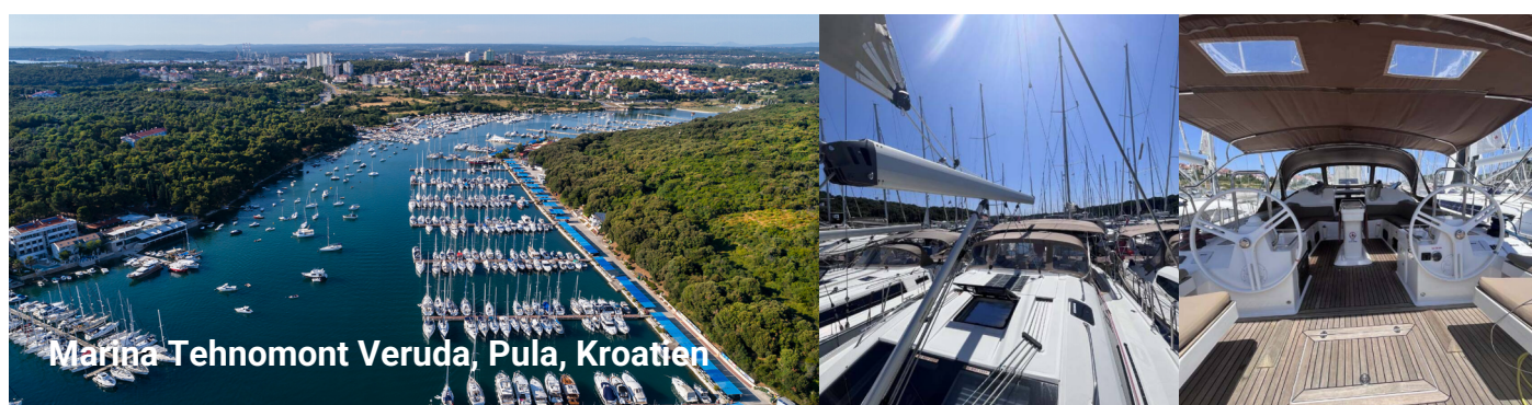
Marina Tehnomont Veruda, Pula, Kroatien