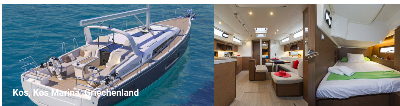
Kos, Kos Marina, Griechenland