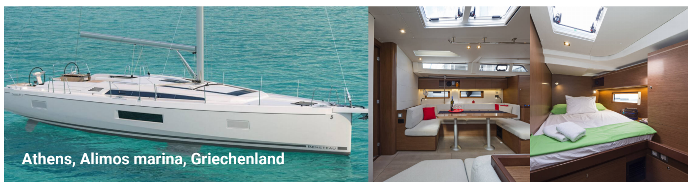
Athens, Alimos marina, Griechenland