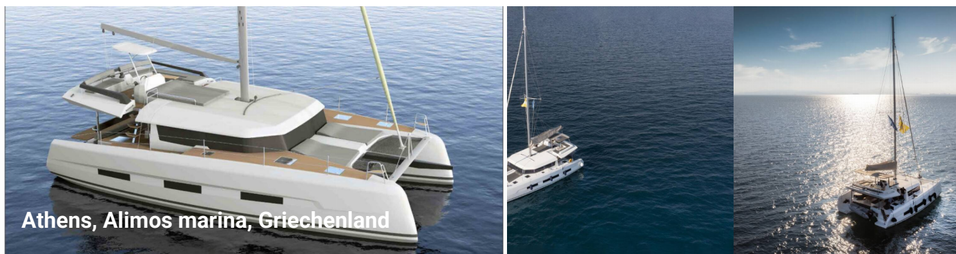
Athens, Alimos marina, Griechenland