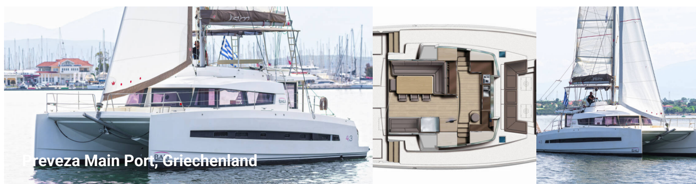
Preveza Main Port, Griechenland