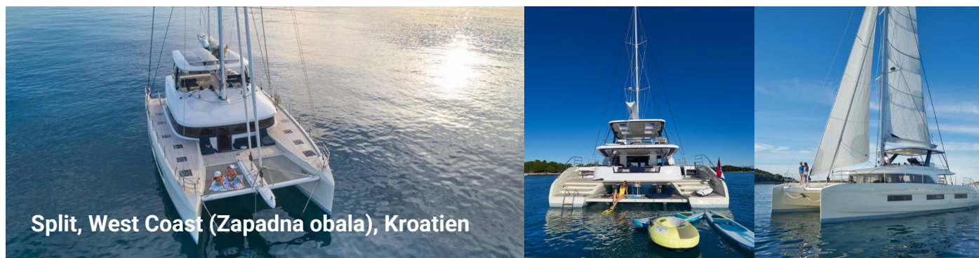
Split, West Coast (Zapadna obala), Kroatien