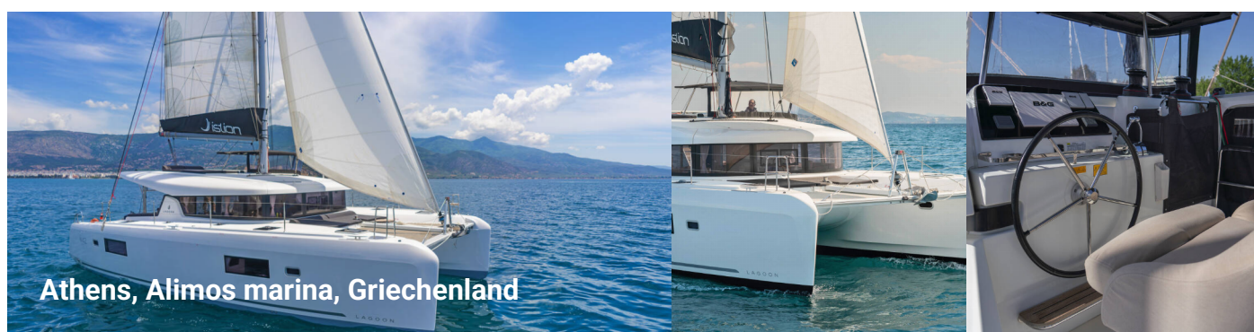
Athens, Alimos marina, Griechenland