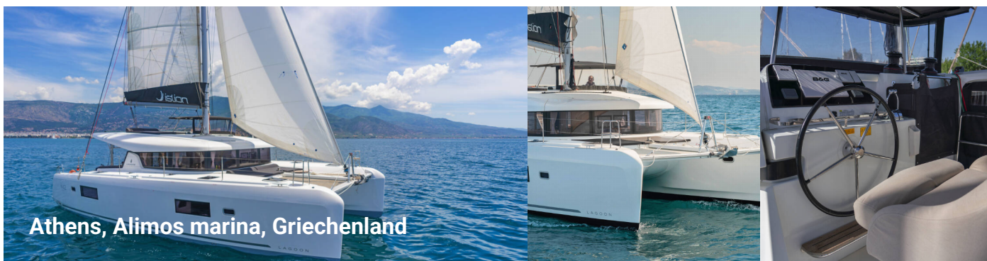
Athens, Alimos marina, Griechenland