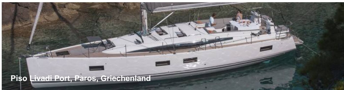
Piso Livadi Port, Paros, Griechenland