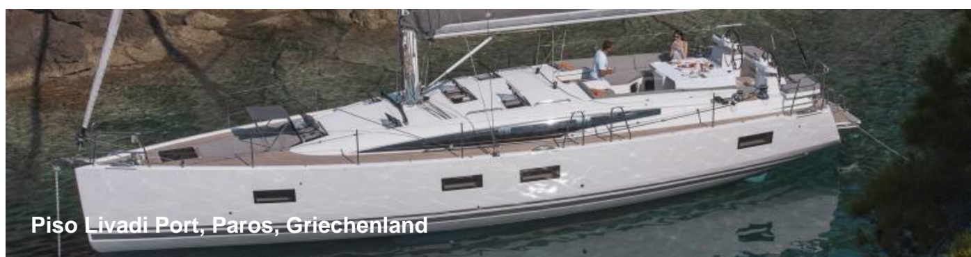
Piso Livadi Port, Paros, Griechenland