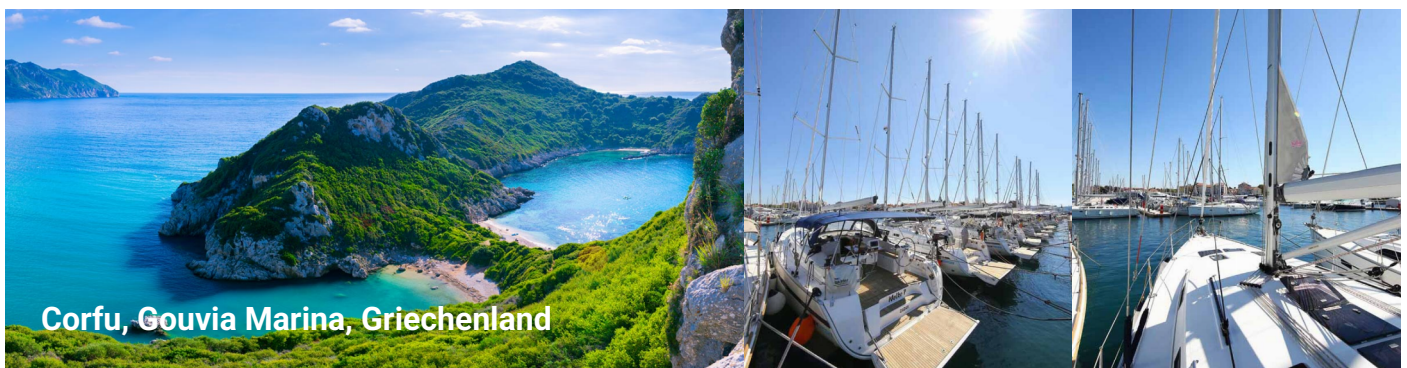
Corfu, Gouvia Marina, Griechenland