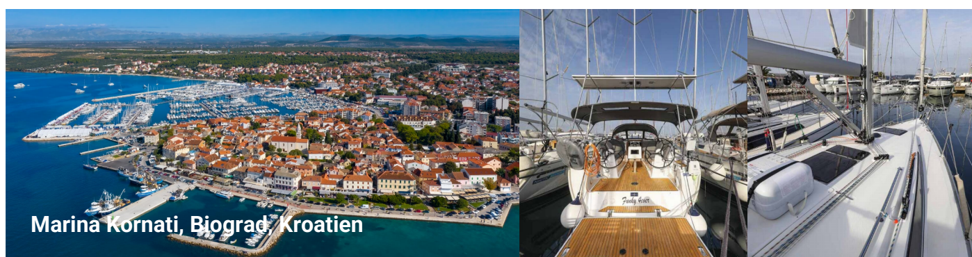
Marina Kornati, Biograd, Kroatien