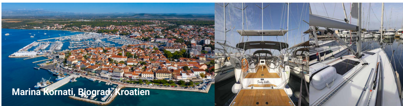
Marina Kornati, Biograd, Kroatien