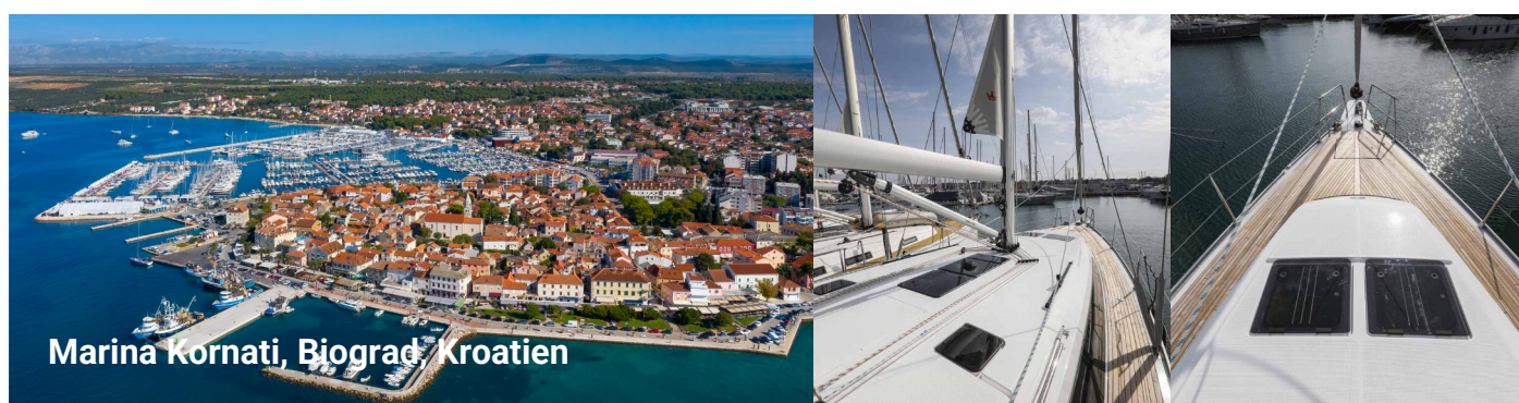
Marina Kornati, Biograd / Kroatien