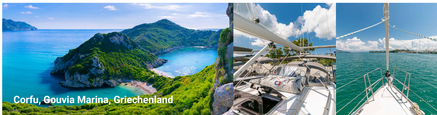
Corfu, Gouvia Marina, Griechenland