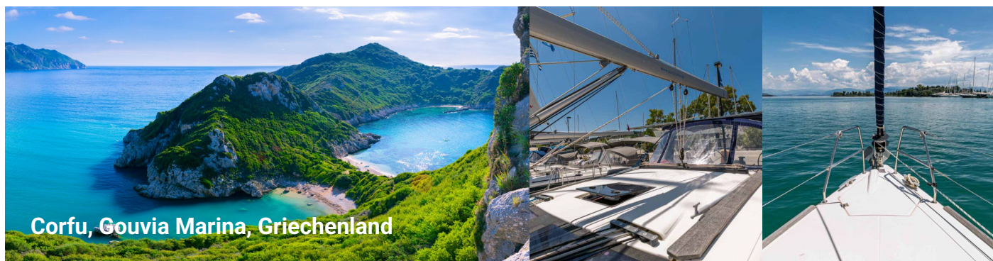
Corfu, Gouvia Marina, Griechenland