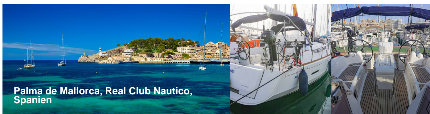
Palma de Mallorca, Real Club Nautico, Spanien